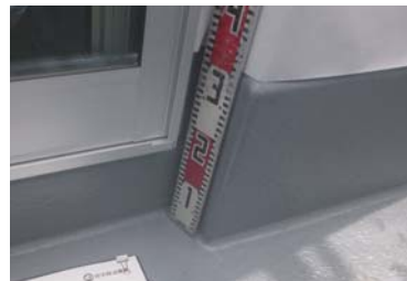
バルコニー開口部下端