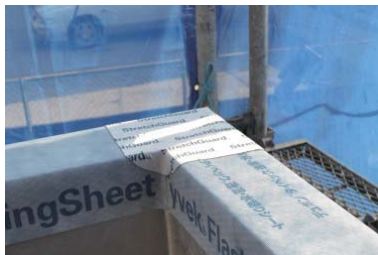
手すり出隅部の3面交点