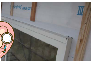
サッシ廻りの防水テープ